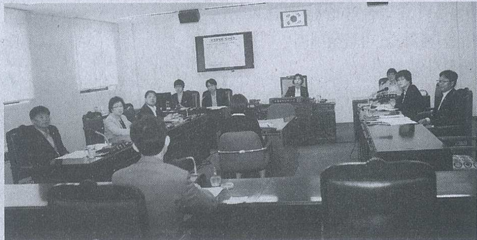
▲ 지난 15일 열린 강북구의회 운영위원회 회의 장면.

제189회 임시회는 첫날인 5월 21일 개회식에 이어 제1차 본회의에서 구정질문과 답변이 이어지고, 5월 22일 제2차 본회의에서도 구정질문과 답변이 진행될 예정이며, 5월 26일부터 5월 29일까지 상임위원회별로 10건의 조례안 및 수유·미아실버데이케어센터 사무의 민간위탁동의안과