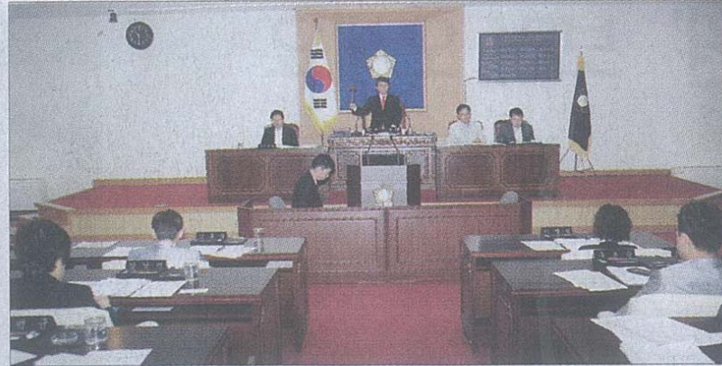
지난 20일 열린 강북구의회 제171회 제1차 정례회 본회의 장면.