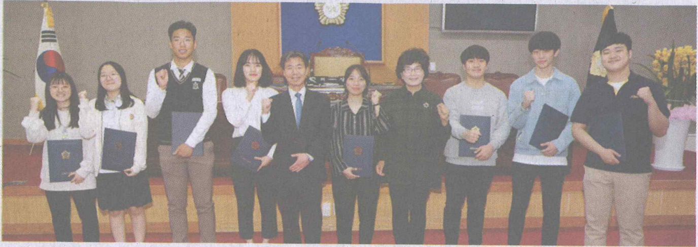
▲ 봉사활동 유공표창을 받은 학생들과 기념촬영.

강북구의회(의장 박문수)는 지난 11일 강북구의회 3층 본회의실에서 봉사활동 학생 유공자에 대한 표창수여식을 진행했다.