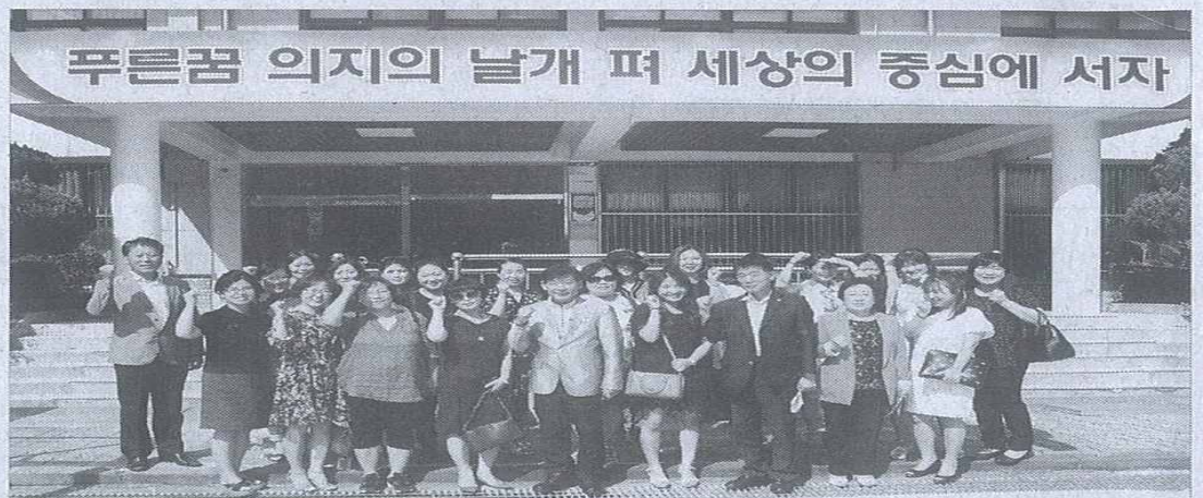
▲ 교육발전특위 의원들이 강북중학교 학부모들과 함께한 모습.

간담회에서 위원들은 학교 운동장 마사토 공사, 기술실 노후 시설 개선, 학교 안내를 도