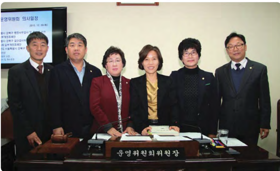
조례안 등 안건 심의